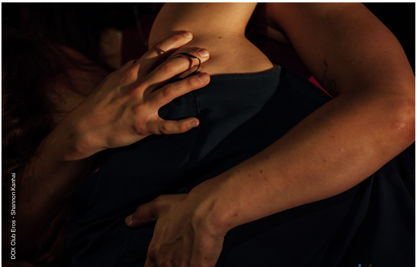
DOX Club Eros - Shannon Kanhai

Onze missie is om de mens terug te werpen op zijn fysieke aanwezigheid. Om zo in contact te komen met een innerlijke wereld van waaruit een gegrond contact kan worden gemaakt met de ander – in al zijn veelzijdigheid – en met de omgeving.