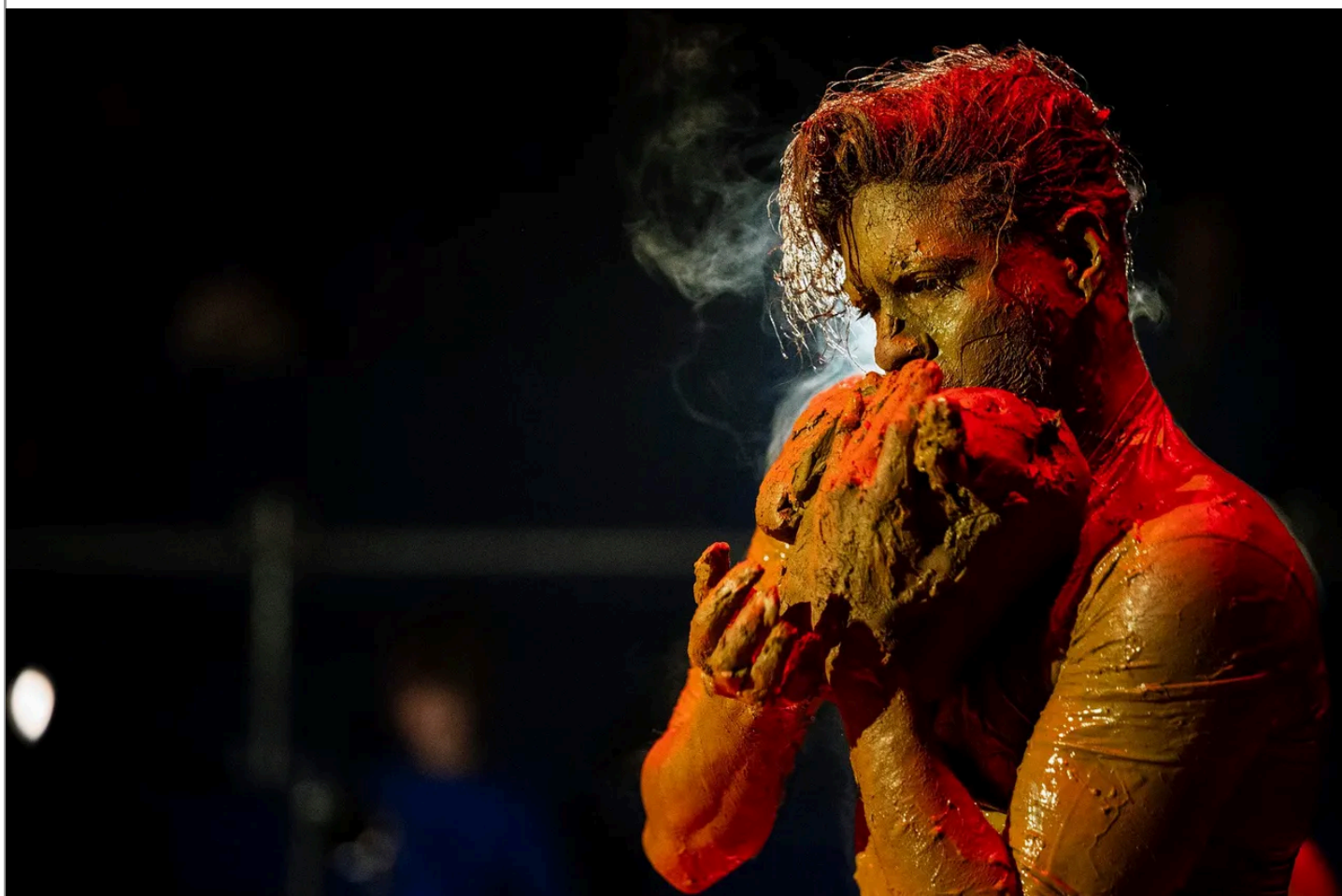
scène uit de theatervoorstelling 'Klei'.