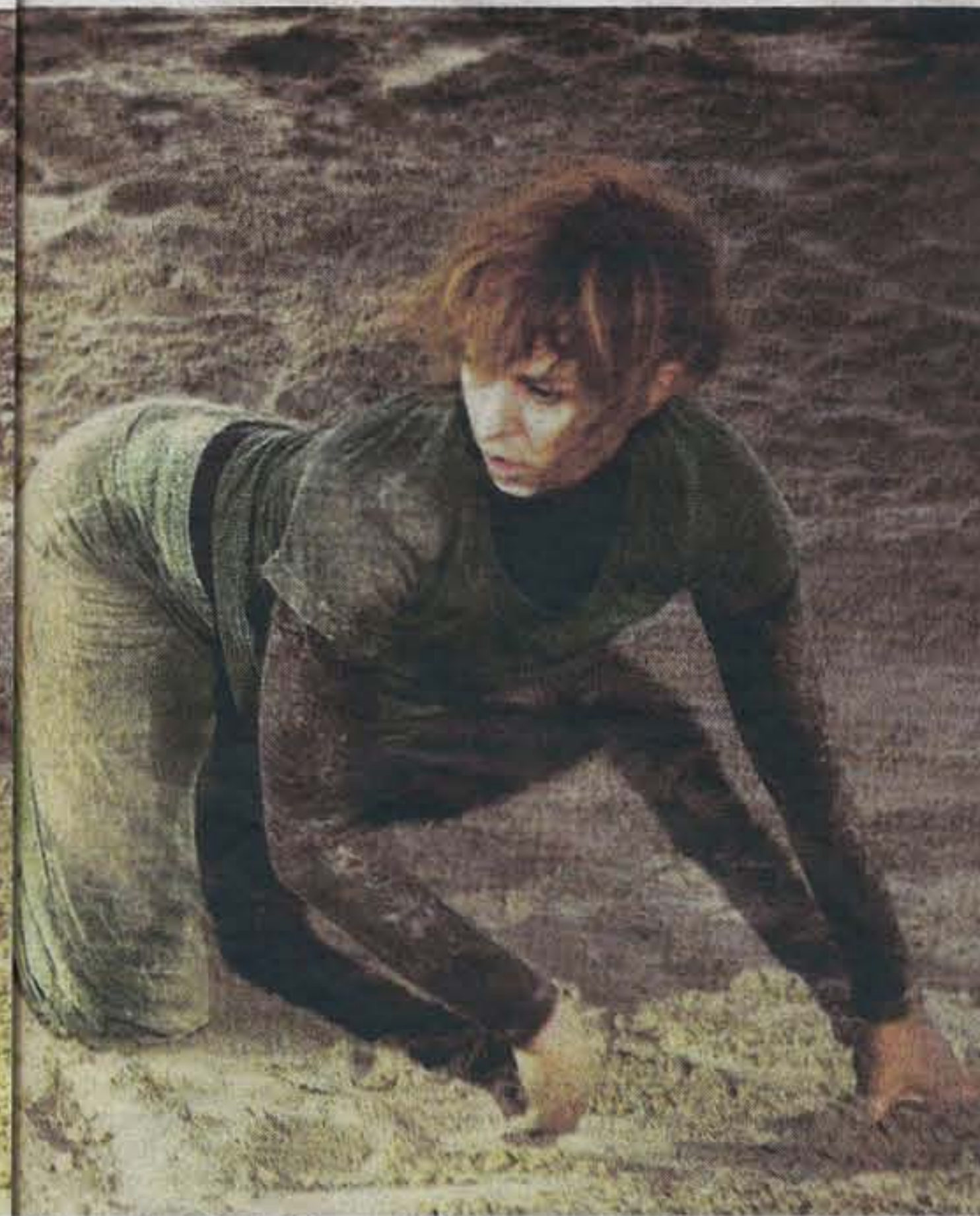
in de voorbereiding wel blessures gehad.'

het gevoel heeft dat er iets gebeurt. Schweigman: "Je hoeft het niet te snappen. Ik wil dat je het voelt. En dat kan alleen als het echt is." Wat